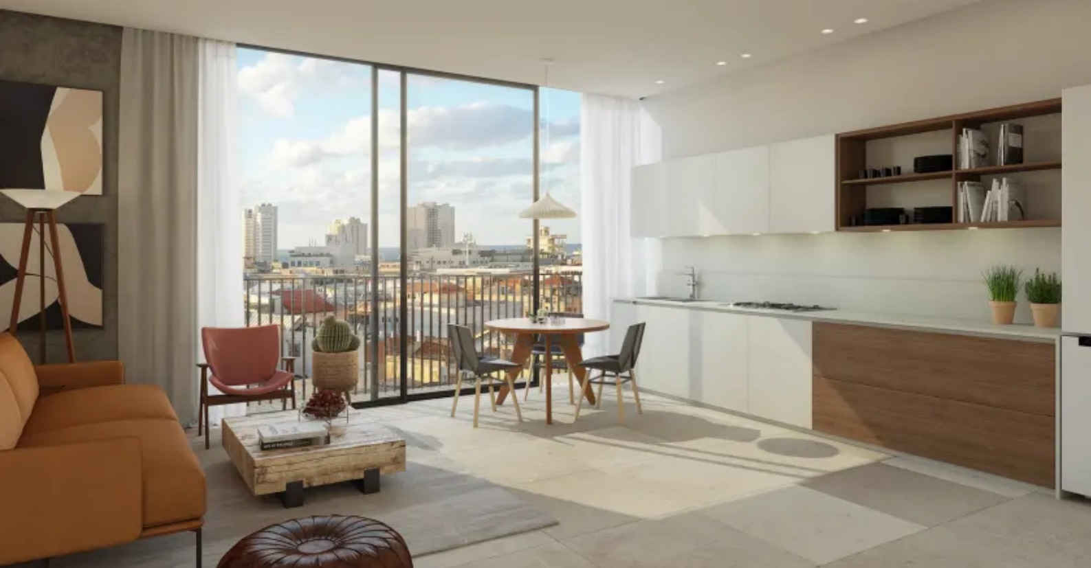
הדירה ברחוב בן יהודה בתל אביב