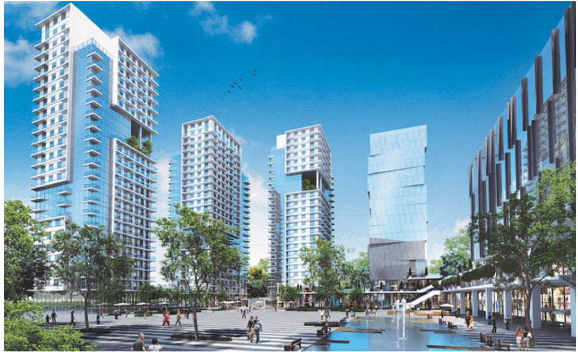
הדמיית פריפלייס רחובות

פרי פלייס רחובות – פרויקט דירות סטודנטים להשכרה - 2 חדרים החל מ 699,00 ש"ח. החברה מציעה הטבת מימון ייחודית, מוגבל ל 20 דירות, עד ל 30/6 - 50 אלף ש הנחה ופריסת תשלומים מותאמת אישית.