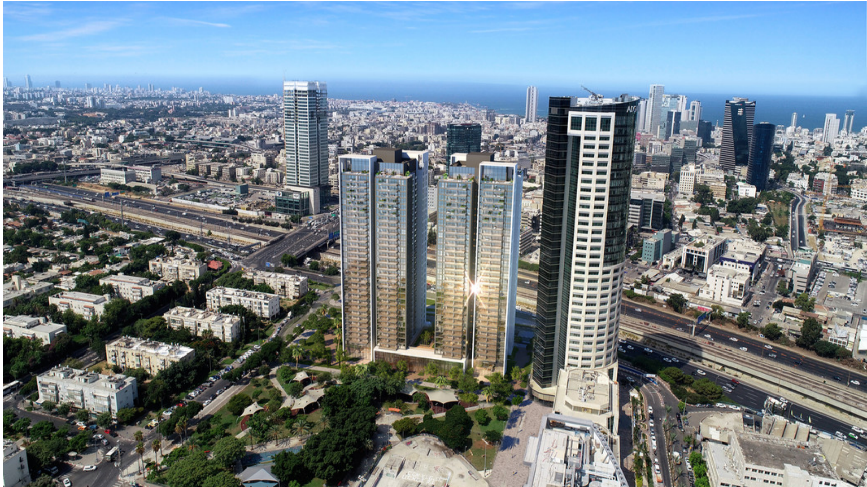
מנדלי אפרהאוס תל אביב

רונית מורגנשטרן | mako | פורסם 27/05/20 07:15