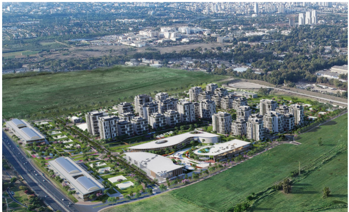
בית בפארק - צומת סביון

בניינים עם כ-2,000 יח"ד על צומת סביון. בשם מבצע "הולכים על בטוח", מעניקה החברה 150,000 שקלים הנחה וגם אפשרות לביטול עסקה עד ה-1.9.20.