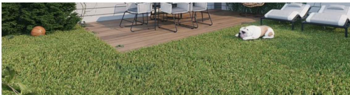
אפריקה ישראל מגורים סביוני גליל ים

חברת צרפתי שמעון יוצאת במבצע מימון לרוכשי דירות בשלב השלישי והאחרון בפרויקט 'צרפתי באגמים' בשכונת אגמים אשקלון. במסגרת המבצע יוכלו הרוכשים לשלם 20% בעת חתימת החוזה ואת ה-80% הנותרים באכילוס, ללא הצמדה למדד. בנוסף תעניק החברה תנאי תשלום מגוונים המותאמים ליכולת התשלום של כל לקוח. מחיר התחלתי לדירות בפרויקט: החל מ-1.28 מיליון שקל