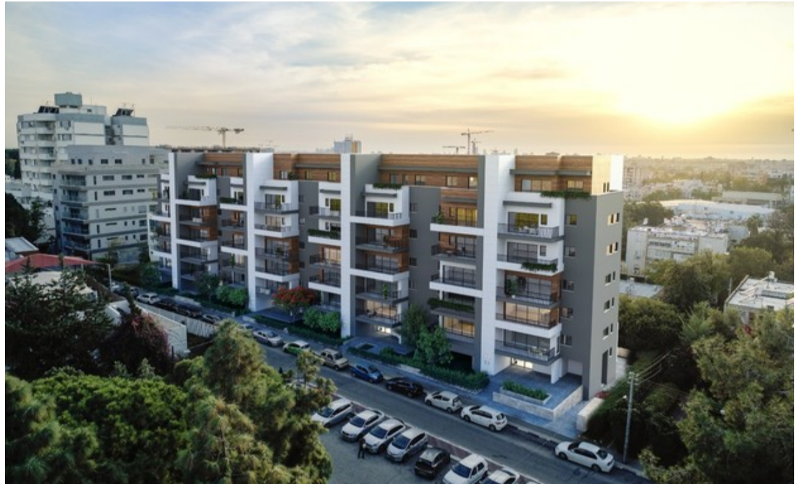
אבני דרך התחדשות עירונית, רחב גונן גונן תל אביב