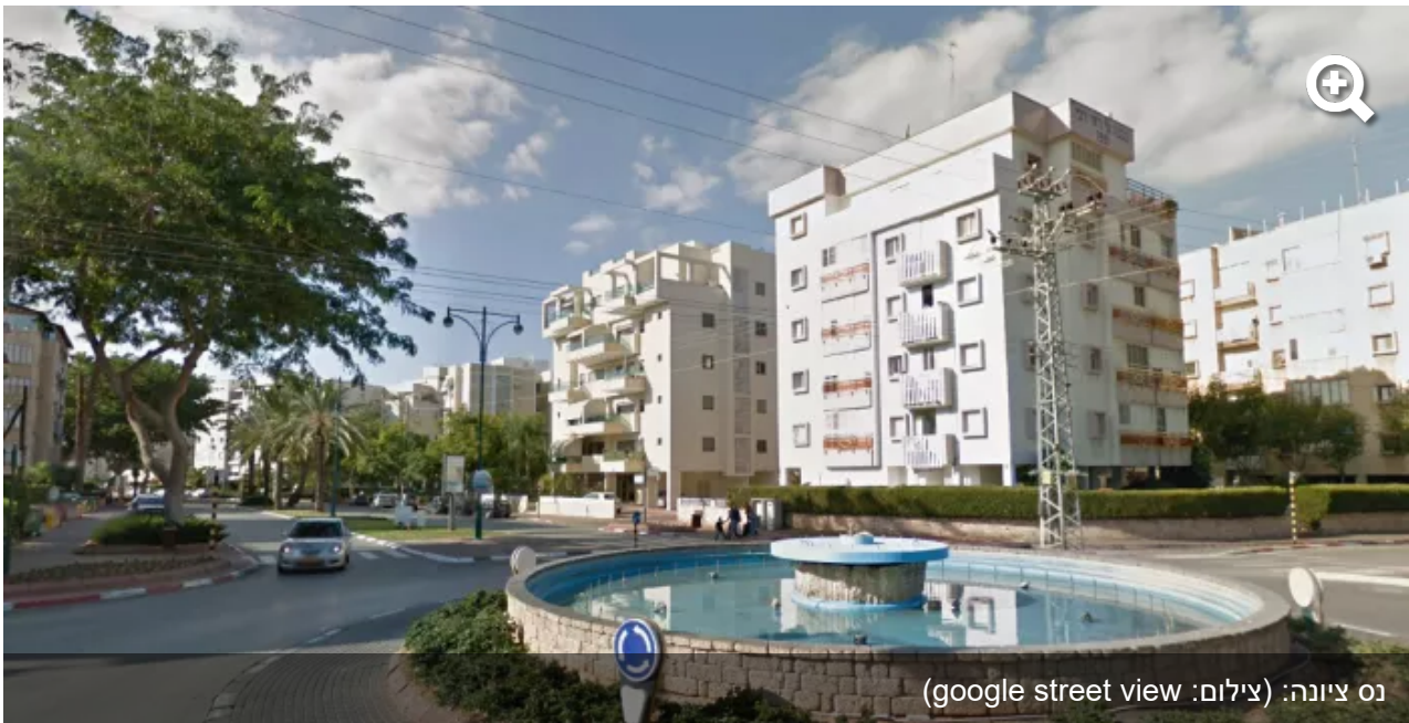
נס ציונה: