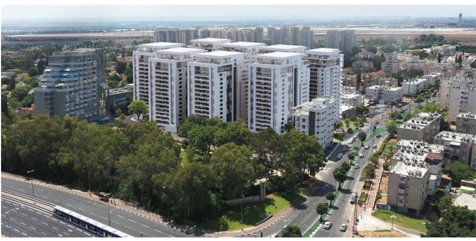
פינני בינוי הכלנית אור יהודה / קרדיט הדמיה: צפור אדריכלים ומתכנני ערים

מתי בפעם האחרונה נמכרה דירה בכחות ממיליון שקל? נדל"ן ותשתיות