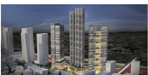
סופית: אושרו מגדל מגורים ושני מגדלי משרדים במתחם הבורסה