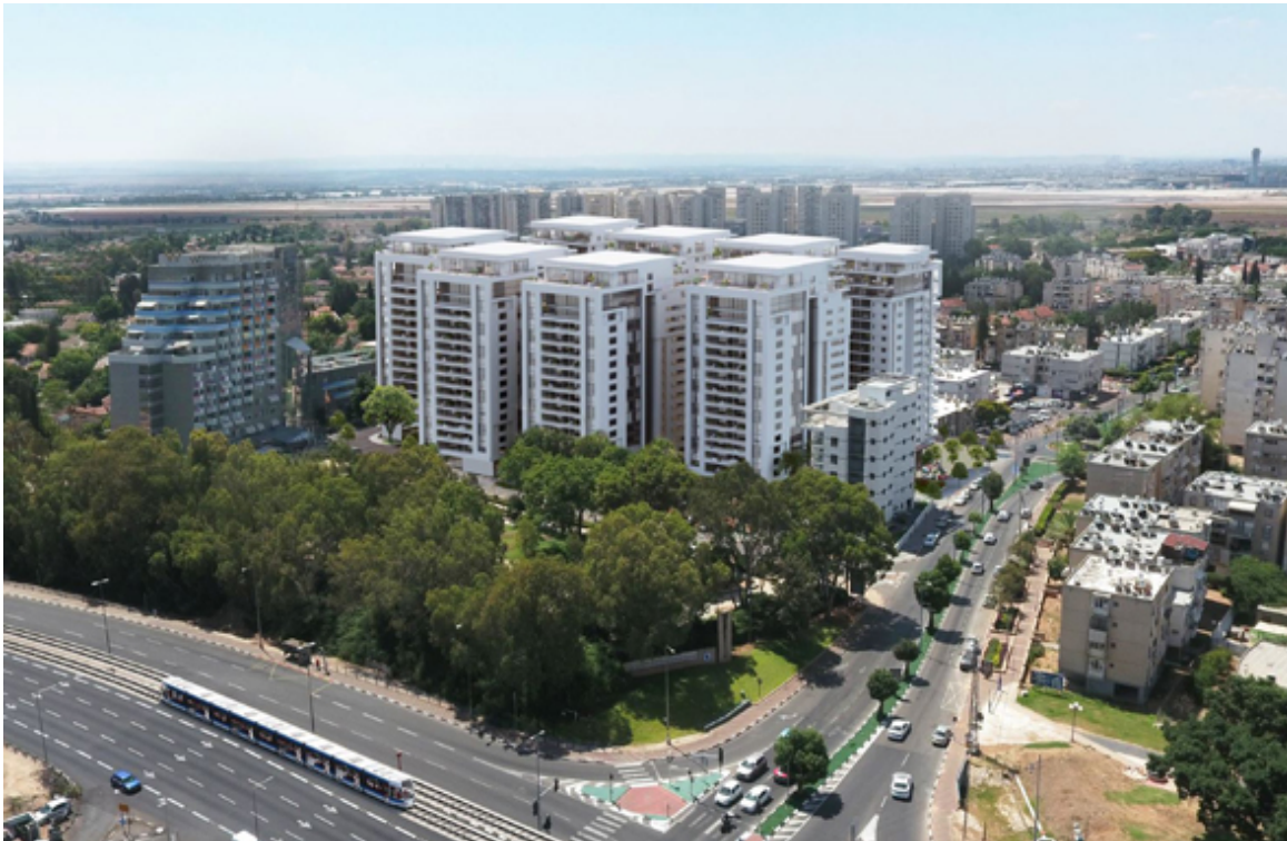
הדמיית הפרויקט באור יהודה, קרדיט: צפור אדריכלים ומתכנני ערים

התוכנית קודמה על ידי עיריית אור יהודה, באמצעות צפור אדריכלים ומתכנני ערים ובניהול אדר' גלי דולב מחברת וקסמן גוברין גבע. במהלך הכנת התוכנית נערכו על ידי צוות התכנון ונציגי העירייה כנסים לשיתוף הציבור, וכן נערך סקר למיפוי מאפייני וצורכי האוכלוסייה בשכונה.