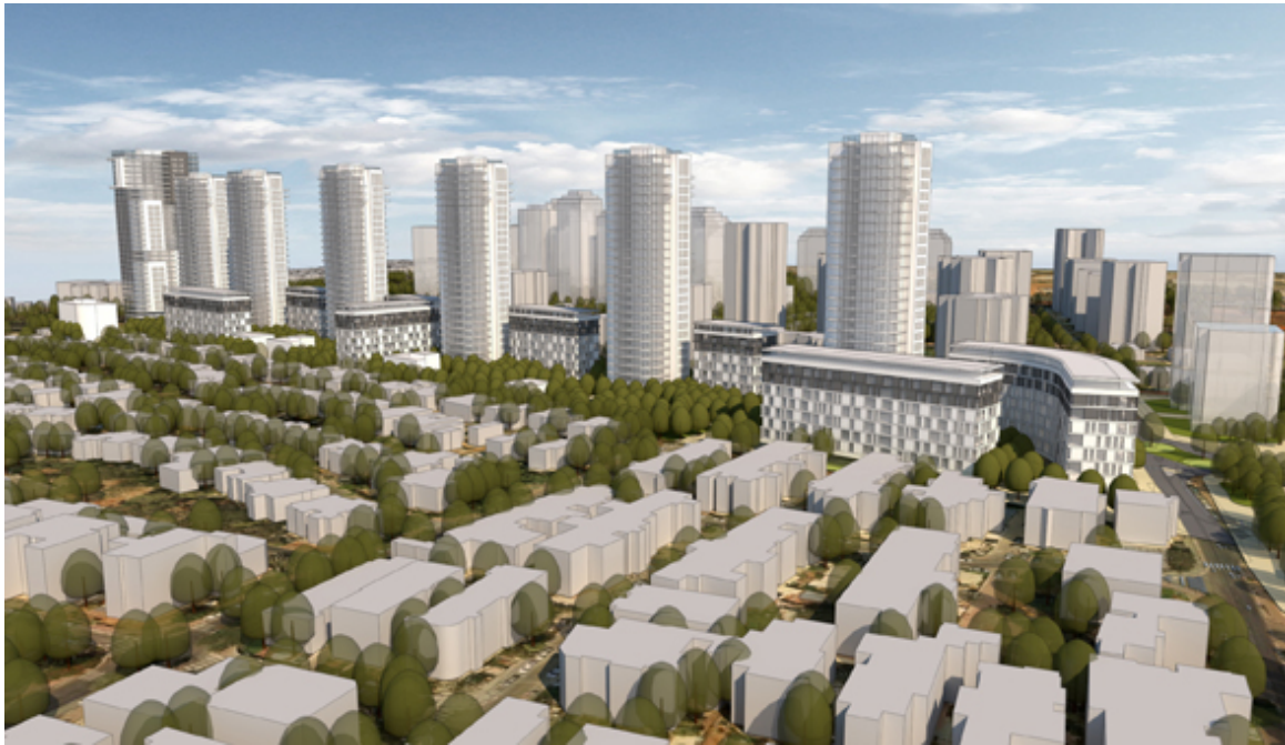
הדמיית הפרויקט בגבעת שמואל קרדיט: פרחי - צפריר אדריכלים בע"מ

התוכנית מחולקת לשלושה מתחמים לאורך רחוב הנשיא: מתחם גיורא המיועד לפינוי בינוי ובו ומשולבים גם שטחים למבני ציבור ותעסוקה; המתחם המזרחי המיועד כקרקע להשלמה, בו מתוכננים מבני מגורים חדשים ושטח ציבורי פתוח; ומתחם נוסף בו מתוכננים מבני מגורים ושטחים למבני ציבור. עוד כוללת התוכנית חזית מסחרית רציפה לאורך רחוב הנשיא, גינות פנימיות וכיכר עירונית על הציר המרכזי, שתשמש כשטח ציבורי פתוח.