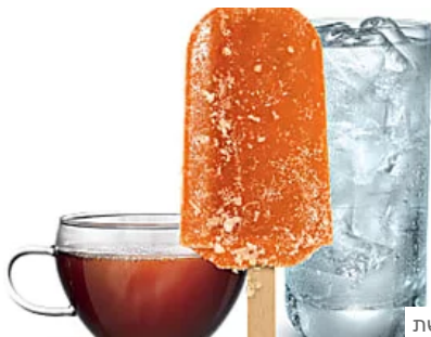
מרחבי הרשת כואב לכם לשתות מים קרים? גלו מהן הסיבות לכך sensodyne