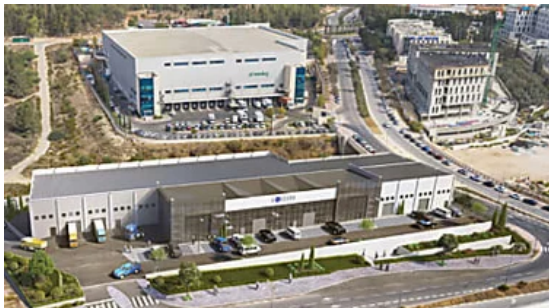
מיטב התעשיינים כבר בחרו פרויקט LOGIN מודיעין כלכליסט - פרויקטים