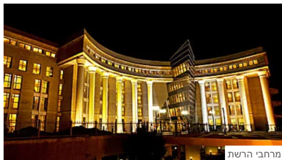
מרחבי הרשת דיור מוגן בירושלים - אלגנטיות בכל פינה ואווירה פסטורלית של עיר הבירה:... דיור מוגן לבני הגיל השלישי