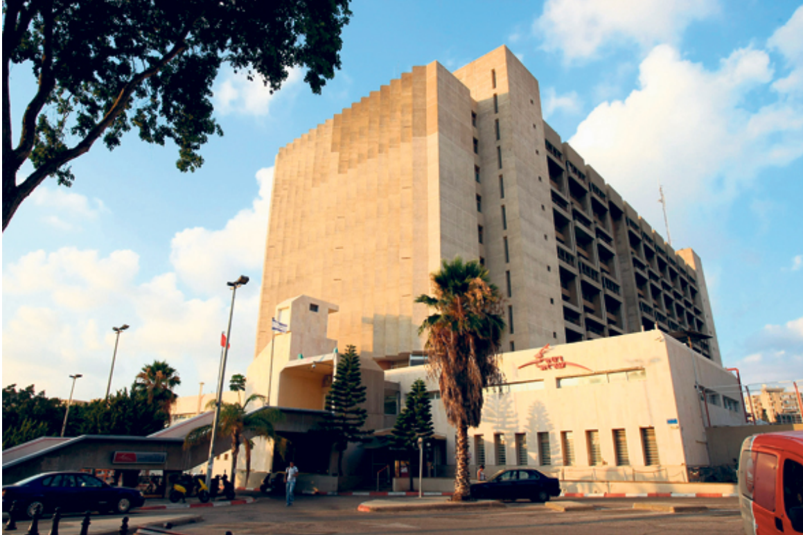
מתחם הדואר ברחוב ההגנה, ת"א

קר על המחדל בדואר: תורים ארוכים, שירות ירוד וחבילות נעלמות נה לדואר: עצרו מכירת מתחם ענק בת"א