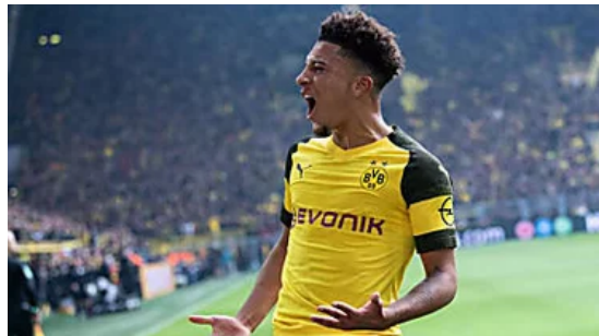
כדי לשפר את הכדורגל שלהם, הגרמנים חוזרים לרחוב