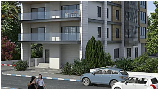
כך תבחרו יזם לניהול תמ"א בבניין שלכם כלכליסט - פרויקטים