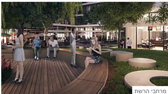
פרויקט המגורים שהולך לשנות את פני פלורנטין Round Table