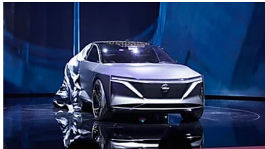
כך ייראו דגמי המנהלים: ניסאן חושפת את ה-IMS