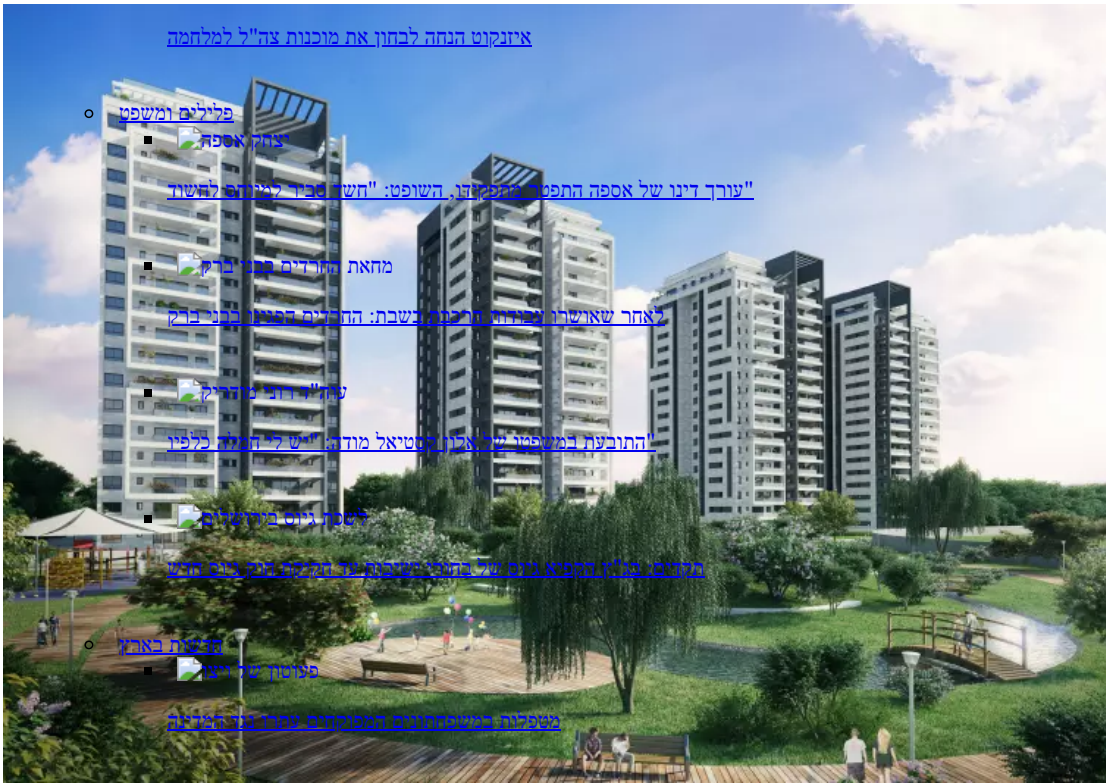
איזנקוט הנחה לבחון את מוכנות צה"ל למלחמה