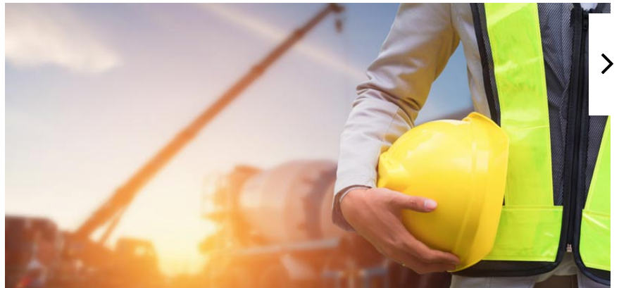
ניהול בטיחות באתר בנייה: ממש כמו מבצע צבאי