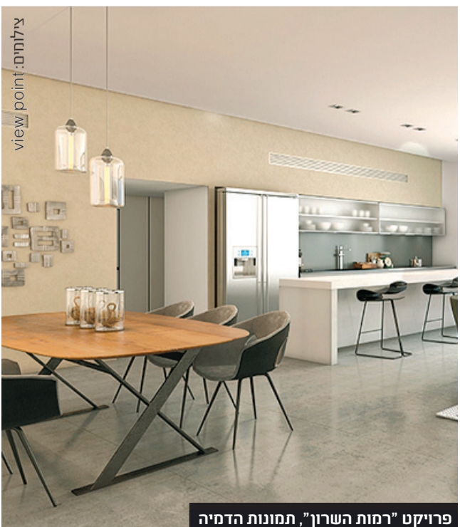
פרויקט "רמות השרון", תמונות הדמיה