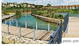
תוכן ממומן לגור בסוד הקטן של גוש דן כלכליסט