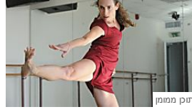
תוכן ממומן הדרך שלי בטיפול בתנועה ומחול המכללה האקדמית לחברה ואומנויות