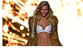
אמזון נכנסת לטריטוריה חדשה: הלבשה אינטימית