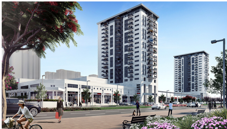
הדמיה: דיג'יטל קלאוד

המרכז המסחרי שישופץ על ידי יובלים במסגרת עבודות הבנייה מוכר כ"מרכז כלניות", וממוקם מול בית החולים אסותא שצפוי להיפתח במהלך 2017 ובסמוך למרכז ביג פאשן, בניין העיריה והמרונה. חלק גדול מהדירות בפרויקט יהיו דירות קטנות בנות 2, 3, ו-4 חדרים, בשטחים שישוע בין 70-110 מ"ר ומחיריהן יחלו ב-1.5 מיליון שקל. לפני כמה חודשים רכשה קבוצת יובלים, עם הזים חן בלינקיס, קרקע מבעלים פרטיים המיועדת להקמת 150 דירות חפנית הרחובות הרצל ושלמה בתל אביב, זאת בתמורה לכ-134 מיליון שקל.