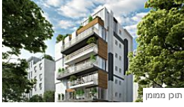
תוכן ממומן בחכים הבאים לפנינת הנדל"ן הבאה של ישראל מגזין אינטרנטי